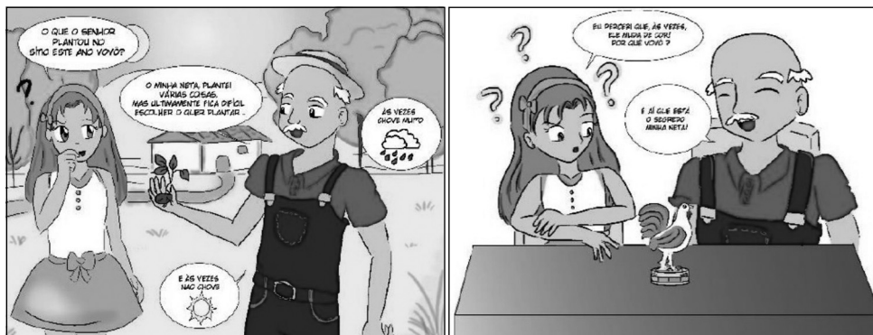
Figura 2 - Cenas que demonstram a dúvida(?) da personagem na narrativa

Como recurso das HQs, utilizamos o sinal de interrogação (?), mostrado na figura 2, para demonstrar que tal situação se assemelha com a da sala de aula, em que dúvidas permeiam o processo educativo e são fundamentais para o êxito do processo de ensino/aprendizagem.