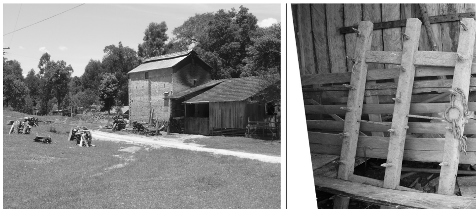
Figura 1 - Geossímbolos moderno-tradicionais do faxinal Taquari do Ribeiros - PR

Seus cosmovisões integraram seus mitos e rituais às suas práticas produtivas; seu conhecimento dos fenômenos geofísicos está associado ao conhecimento de diferentes tipos de solos e condições topográficas, permitindo um aproveitamento complementar do espaço ecológico e gerando estratégias de uso múltiplo e integrado dos recursos (LEFF et al, 2002, p. 500).