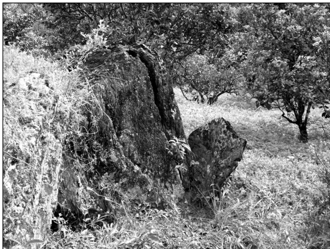
Figura 2 - Depósito de tálus em sopé de vertente com presença de matacões nos limites legais da RPPN Alto Gamarra (Baependi, MG)