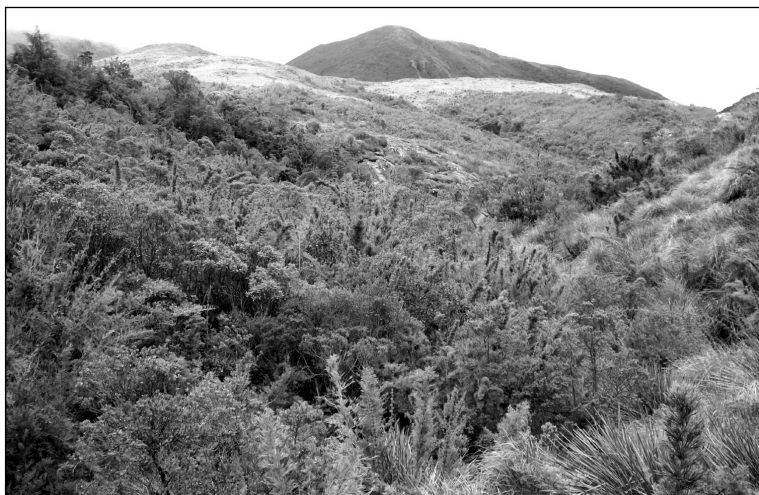
Figura 5 - Paisagem aberta comandada pelos campos de altitude no Parque Nacional do Itatiaia (Itamonte, MG)

No domínio tropical atlântico, a paisagem de exceção que se define pelos campos de altitude na parte alta do Parque Nacional do Itatiaia (figura 5) também configura área de alerta, estabelecendo uma estreita e recíproca relação entre os atributos climáticos/geológicos/geomorfológicos/pedológicos/vegetacionais e os riscos de incêndio associados, sejam eles naturais, acidentais ou criminosos. Em julho de 2001 cerca de 600 ha de campos de altitude foram consumidos pelo fogo no Parque do Itatiaia, e em 2007 1000 ha de vegetação campestre foi queimada, conforme relatado por Aximoff (2007). É ainda bem conveniente que se frise o fato dos incêndios também serem importantes fatores de risco para áreas densamente florestadas e sombreadas, conforme se verificou em uma miríade de fragmentos da mata atlântica e do cerrado (pertencentes ou não a áreas protegidas) durante o rigorosamente estio inverno de 2010, quando o próprio Parque do Itatiaia e o avizinhado Parque Estadual Serra do Papagaio não ficaram imunes ao fogo.