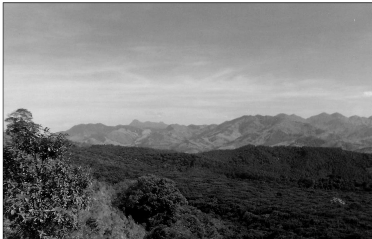
Figura 1 - Vista parcial da Floresta Nacional de Passa Quatro (MG): relevo montanhoso e densamente dissecado com alta fragilidade potencial

Os volumosos fluxos de detritos e as corridas de lama que atingiram a Floresta Nacional de Passa Quatro durante as chuvas da primeira semana do ano 2000 apresentavam potência para ter desencadeado soterramento se a área fosse habitada ou por ocasião de funcionários e visitantes no local. Os materiais mobilizados tiveram no contato litológico entre os nefelina-sienitos e os plagiognaisses seu eixo preferencial de movimentação. Os planos de escorregamento são feições ainda conspícuas nas encostas, e grande parte do material transportado se acumulou nas morfologias agradacionais ou passou a compor a carga de fundo dos canais, o que vem determinando acentuada reorganização erosiva dos cursos d'água que dissecam a floresta.