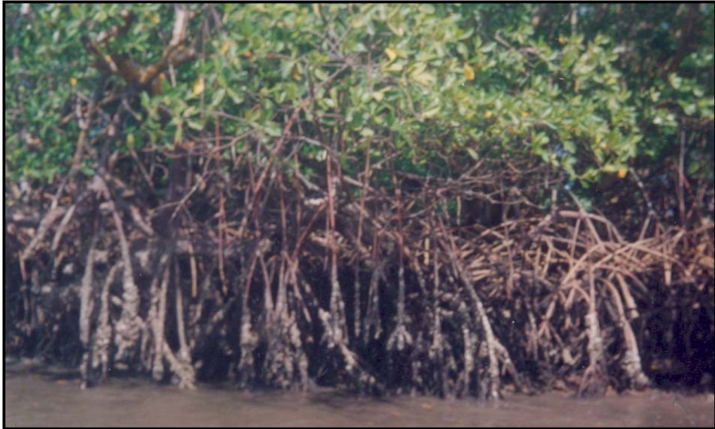
Foto 4 - Planície flúvio-marinha : atividades de caça e pesca predatória exercendo uma maior pressão sobre os recursos faunísticos, com a eliminação ou diminuição seletiva de espécies animais, desestruturação dos ciclos biogeoquímicos, perda do potencial genético e das funções ecológicas das espécies eliminadas.

Autor: Agostinho Paula Brito Cavalcanti, setembro (2006).