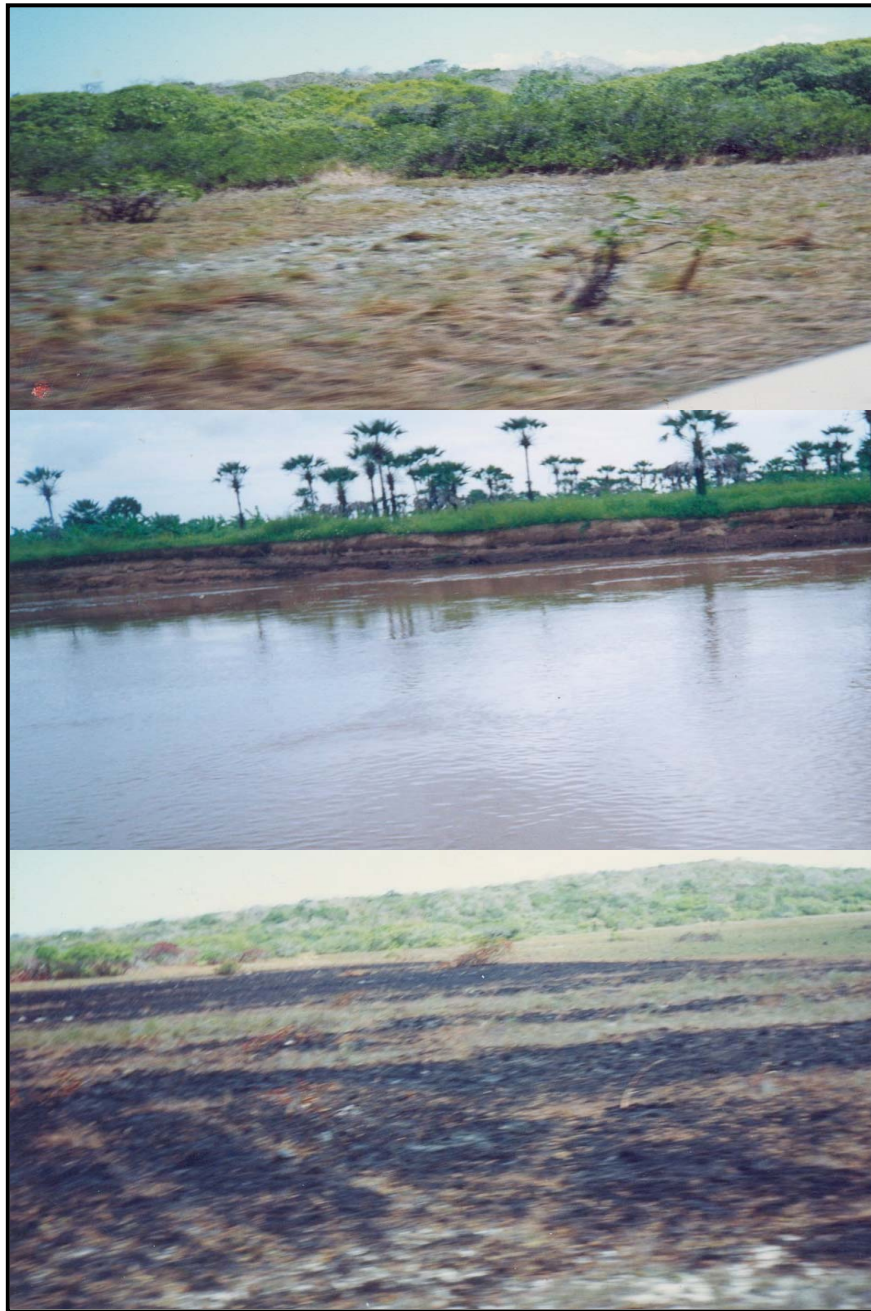
Foto 1 - Desmatamento: retirada da vegetação natural para uso energético, construção de embarcações e habitações, causando modificações micro-climáticas que elevam a temperatura, evaporação hídrica superficial e edáfica, aumentando a perda de água do solo;

Foto 2 - Contaminação hídrica e edáfica: provocada pelo lançamento de resíduos domésticos e agropecuários, trazendo consigo alterações de suas propriedades físico-químicas;