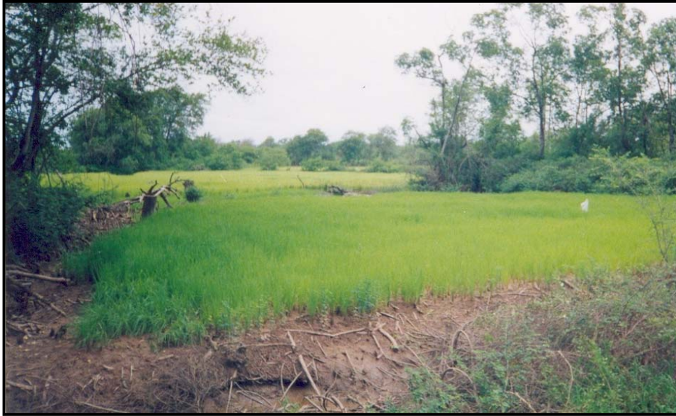
Foto 6 - Planície flúvio lacustre: atividades agrícolas inadequadas (rizicultura) com a retirada da cobertura vegetal e interrupção do fluxo natural das águas, aumento da salinidade, e nivelamento e compactação dos solos, provocando erosão, devido à ação da gravidade e a intensidade do escoamento superficial, o processo de erosão é acentuado, afetando principalmente as vertentes mais íngremes, as mais arenosas, aquelas desprovidas de vegetação e mal utilizadas na agricultura.