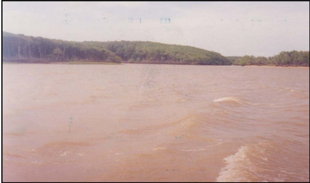
Foto 5 - Planície fluvial: desenvolvimento do processo de assoreamento, devido à intensificação do avanço de sedimentos, acarretando uma diminuição do potencial de uso e regeneração dos recursos naturais, estando relacionado ao excesso de exploração por usos tradicionais, provocando alteração da drenagem, frequência de inundações e modificações na estrutura física e química dos solos. Autor: Agostinho Paula Brito Cavalcanti, setembro (2006).