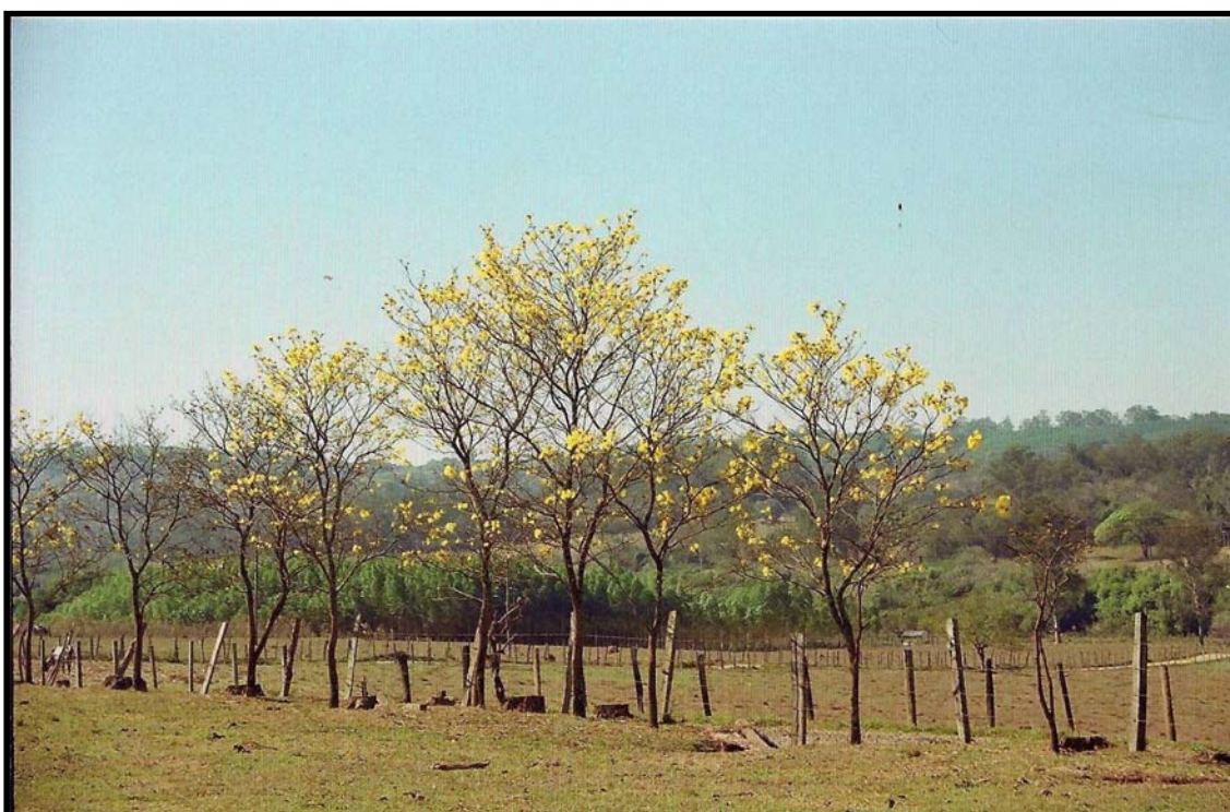
Foto 1: Lugar em setor de contato da média Depressão Periférica Paulista com as cuestas arenítico-basálticas, em Corumbataí (SP). Altitude de 675m em área de aplainamento. A floração teve seu início em 29 de julho de 2010 e se estendeu até 3 de agosto de 2010. O máximo atingido foi entre 4 e 14 de agosto de 2010, com uma duração de 9 dias. (Foto: Adler Guilherme Viadana, agosto/2010).

No presente estudo, tivemos os seguintes resultados: