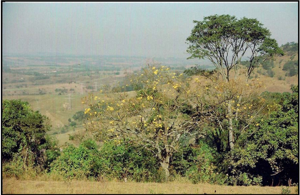
Foto 3: No topo das cuestas arenítico-basálticas (870), em Corumbataí (SP), o ipê amarelo iniciou a florada no dia 17/07/2010 e finalizou-a entre 25/07/2010 e 03/08/2010, com duração de 8 dias. A foto registra a etapa final da floração. (Foto: Adler Guilherme Viadana, agosto/2010).