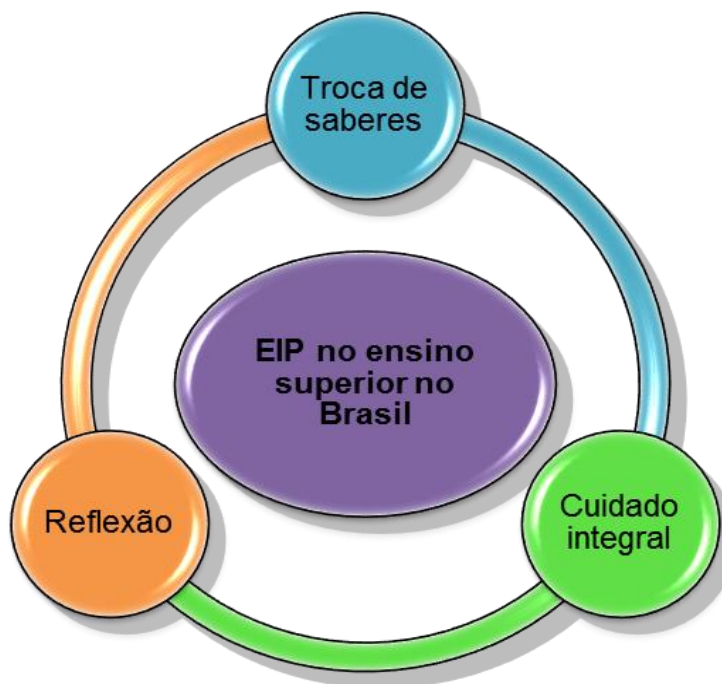
Figura 2 – Fatores relacionados à EIP no ensino superior no Brasil.