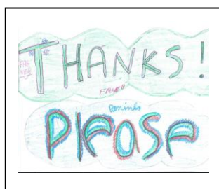
Figura 1 – Atividade feita pelos alunos

Depois da observação de minha aula na turma de 2º ano do 3º ciclo ... a X (questionou ou comentou) alguns pontos que poderiam estar sendo melhorados durante as minhas aulas de LI. Ela disse que eu deveria usar mais inglês em frases simples, comando, para que os alunos tivessem um contato maior com a língua. Então, na aula seguinte, eu sugeri aos alunos que a partir daquela aula nós usaríamos algumas expressões durante as aulas de LI. Fui criando situações e escrevendo no quadro as “expressions”, como: close the door, open the door... até somar 15 expressões. Cada aluno ficou responsável por escrever sua expressão de forma bem colorida para fixar no mural, que fizemos na sala [conforme figura abaixo]. Senti que a partir deste dia a maioria dos alunos que encontravam comigo sempre falava alguma expressão em inglês. Achei válida a experiência e estendi a idéia em todas as outras turmas. Tem sido muito gratificante e os alunos demonstraram um entusiasmo a mais. Alguns, é claro, ainda estão inibidos, mas em geral houve um aquecimento na sala. Esta foi a primeira experiência que surtiu um efeito positivo na sala 5, pois é uma turma bastante apática e é difícil conseguir uma participação em massa (Maria Clara).