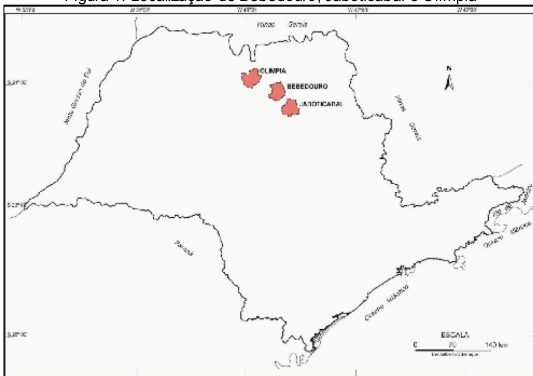
Figura 1: Localização de Bebedouro, Jaboticabal e Olímpia

A Figura 1 mostra a localização geográfica dos territórios municipais de Bebedouro, Jaboticabal e Olímpia, onde se encontram as três respectivas cidades.