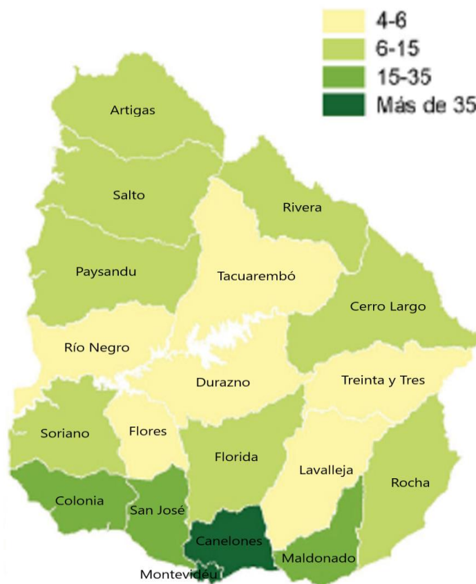
Figura 1. Densidade Populacional por Departamento– habitantes por km 2