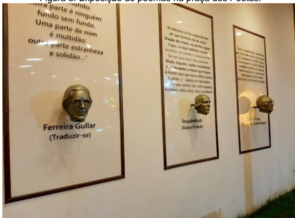
Figura 3. Exposição de poemas na praça dos Poetas.