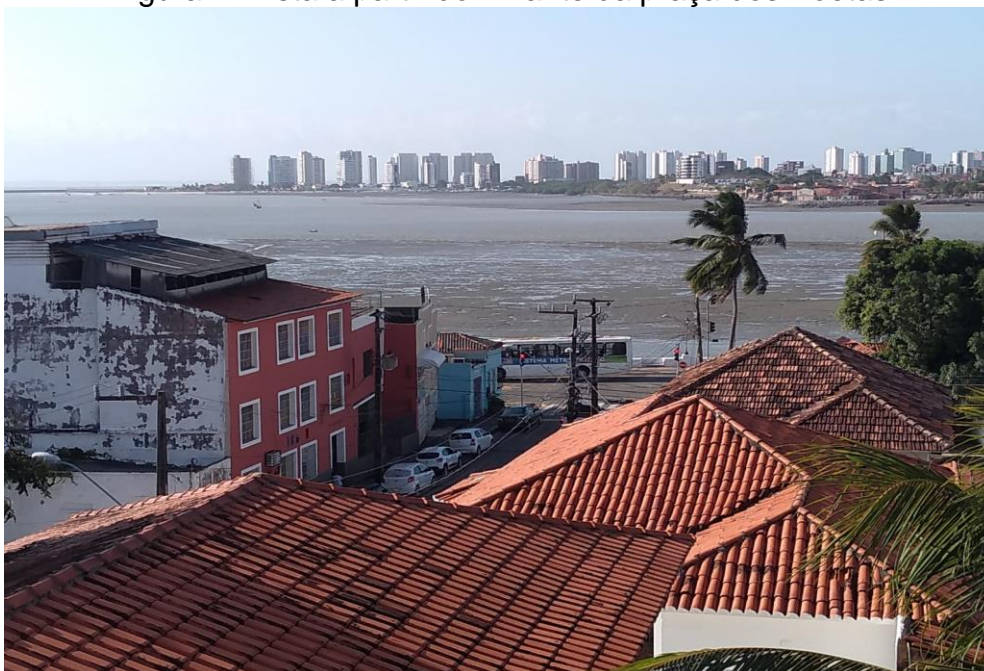
Figura 2. Vista a partir do mirante da praça dos Poetas

Conforme exposto pelo Governo do Estado do Maranhão (2020), a área correspondente à praça dos Poetas é de 1.130m 2 , e com relação aos demais detalhes do local, percebe-se que o intuito foi traçar linhas de cobertura singelas a fim de não carregar e obstruir a vista da cidade, assim proporcionando uma visão contrastante da cidade antiga e atual, este cenário pode ser melhor identificado a partir do mirante da praça (Figura 2).