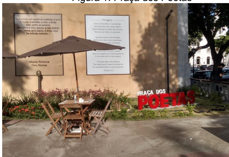
Figura 1. Praça dos Poetas

A obra é inaugurada no ano de 2020, e conta com um mirante que proporciona aos visitantes uma visão panorâmica de São Luís, também conta com quiosques para a comercialização de comidas típicas, café e outras variedades. O espaço ainda possui banheiros públicos, bancos, áreas verdes e detalhes arquitetônicos que relacionam o moderno e o colonial. A Figura 1 apresenta a caracterização da praça dos poetas.