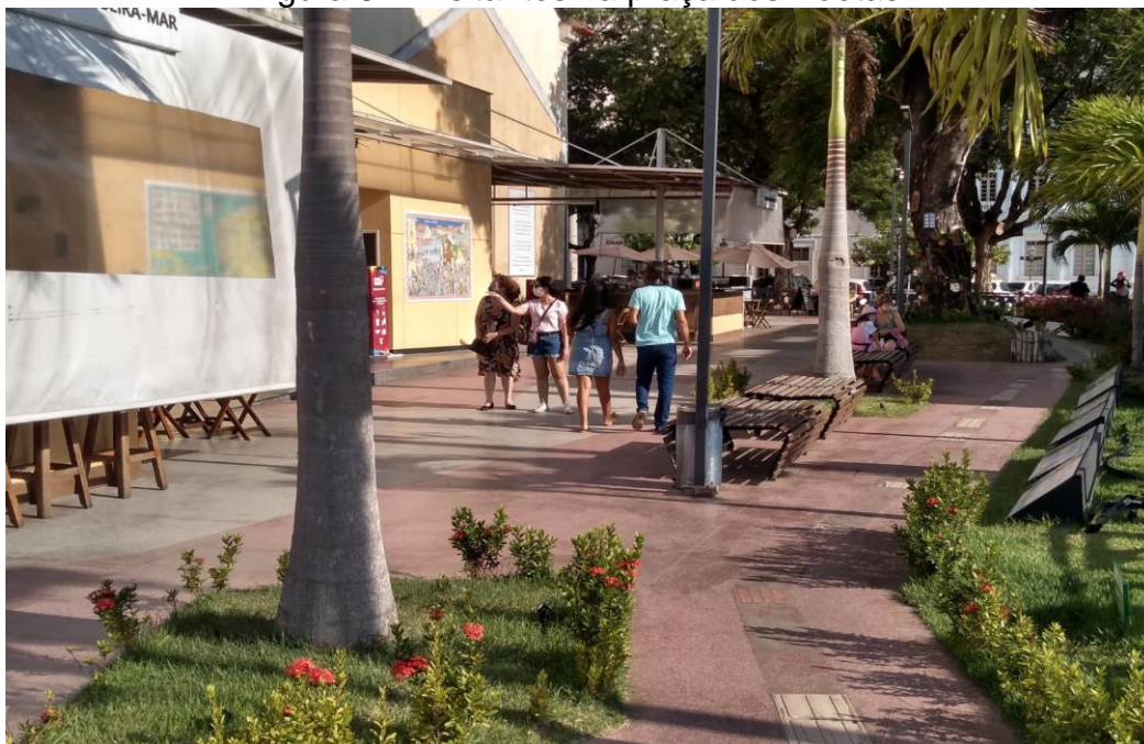
Figura 6 – Visitantes na praça dos Poetas.