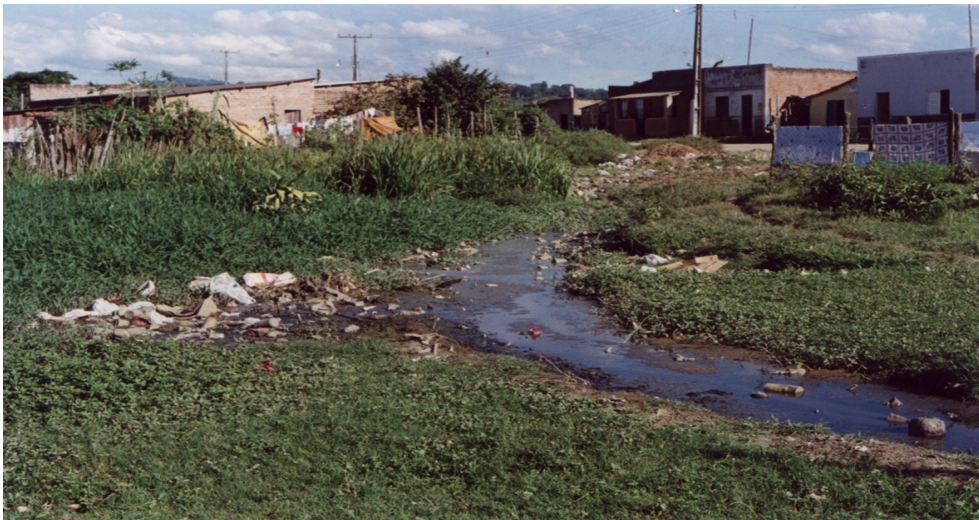
Figura 5 - Exemplo de déficit qualitativo com condição de subnormalidade - Contaminação de cursos d'água por esgoto e lixo (Nova Ferradas)

Segundo a PMI (2001) o déficit habitacional quantitativo de Itabuna abrange as unidades coabitadas ou situadas em áreas que apresentem risco de inundação, deslizamento ou contaminação, que se localizam em áreas de preservação ambiental, bordas de cursos d'água e encostas, como também as localizadas em faixas de domínio de oleodutos e linhas de transmissão, entre outros, implicando na necessidade de construção de novas unidades habitacionais, a exemplo das construções da localidade em Nova Ferradas (Figura 5).