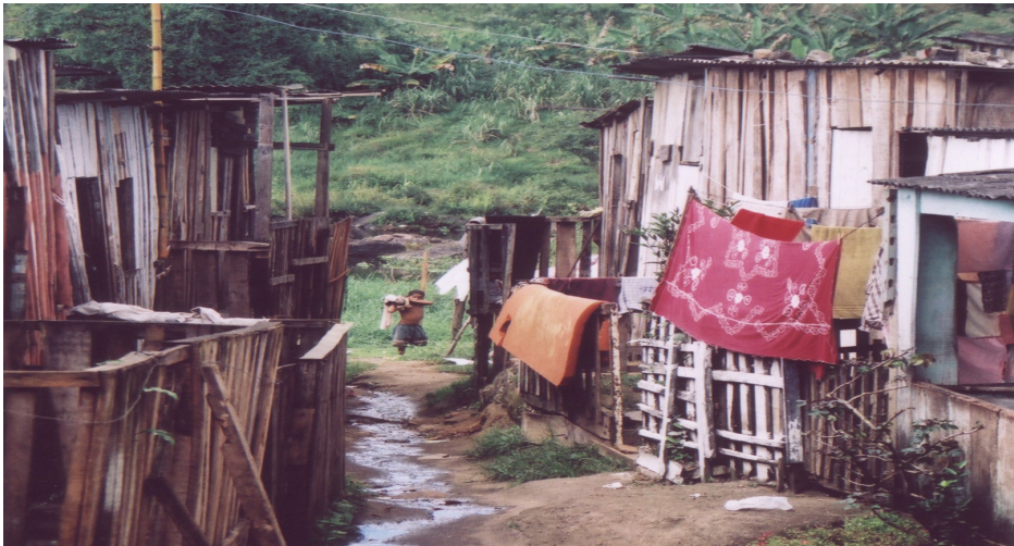
Figura 6 - Exemplo de déficit qualitativo com condição de subnormalidade - Esgoto correndo a céu aberto (Beira-Rio Nova Itabuna)