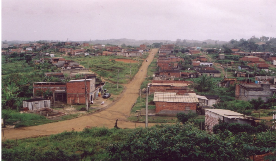
Figura 2 - Vista panorâmica do loteamento Jorge Amado, em Itabuna, Bahia.