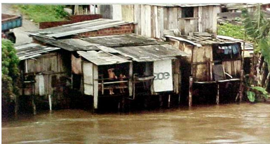
Figura 4 - Moradias construídas à margem do Rio Cachoeira, sem assistência pública (bairro Bananeira).

Muitas vezes as condições de subnormalidade são encontradas mesmo em moradias ofertadas pelo próprio poder público que, na urgência de sanar situações mais agravantes de risco e déficit habitacional, financia construções em terrenos sem infra-estrutura. Esses terrenos, sobretudo, por estarem afastadas do perímetro central urbano, e também devido às mudanças de governo, tendem a assim permanecer.