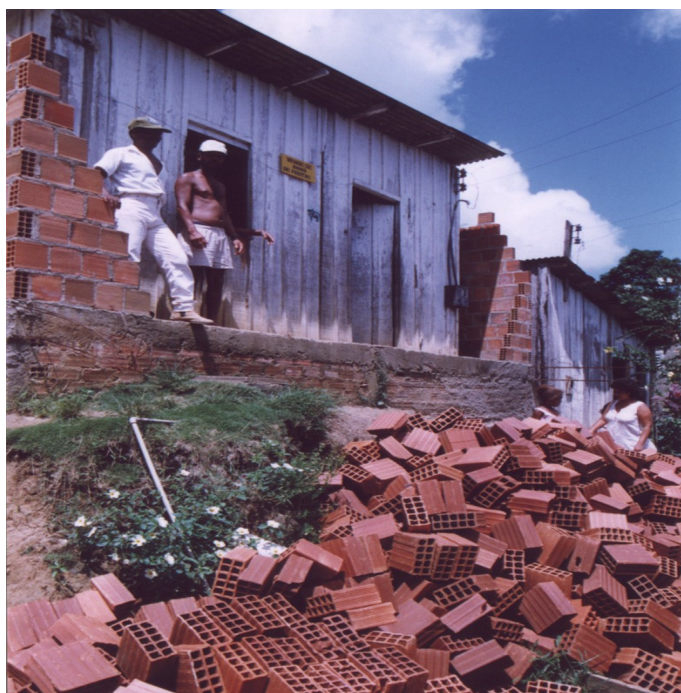
Figura 1 Casas construídas através do programa “Unidos Teremos Casas”, no bairro Nova Califórnia.