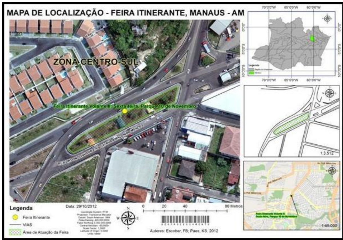
Figura 09 - Mapa de localização feira itinerante Parque 10 de novembro, Manaus - AM.