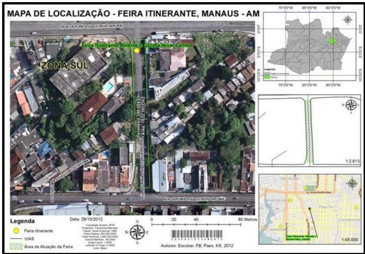
Figura 04 - Mapa de localização feira itinerante Praça 14 de Janeiro, Manaus - AM.