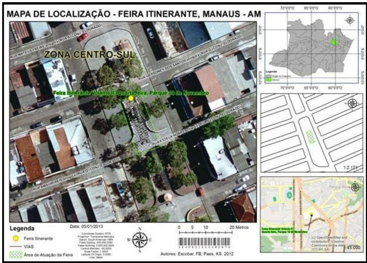
Figura 07 - Mapa de localização da Feira itinerante Parque 10 de Novembro (cj. Eldorado), Manaus - AM.