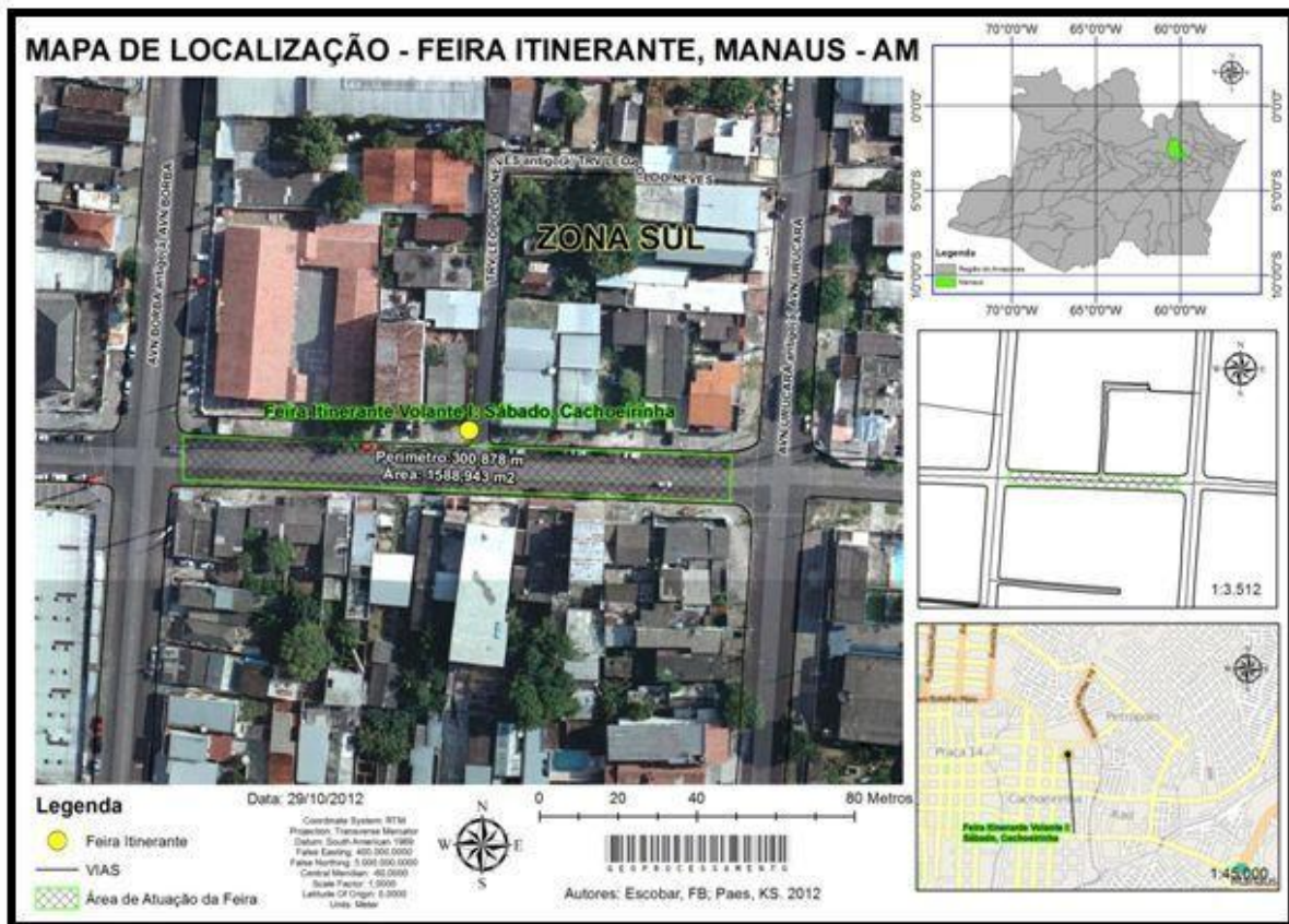
Figura 06 - Mapa de localização feira itinerante Nossa Senhora das Graças - Cachoeirinha, Manaus - AM.