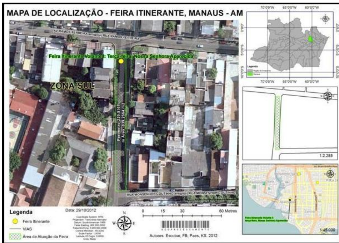
Figura 02 - Mapa de localização feira itinerante Nossa Senhora Aparecida, Manaus - AM.

A feira de Nossa Senhora Aparecida, localiza-se na zona Sul de Manaus, esta feira caracteriza-se por ser a segunda maior em relação às outras feiras itinerantes, e seu público corresponde a maior participação de religiosos católicos que freqüentam as chamadas novenas que acontece no mesmo dia em que a feira atua. Na figura 02 mostra a localização desta feira