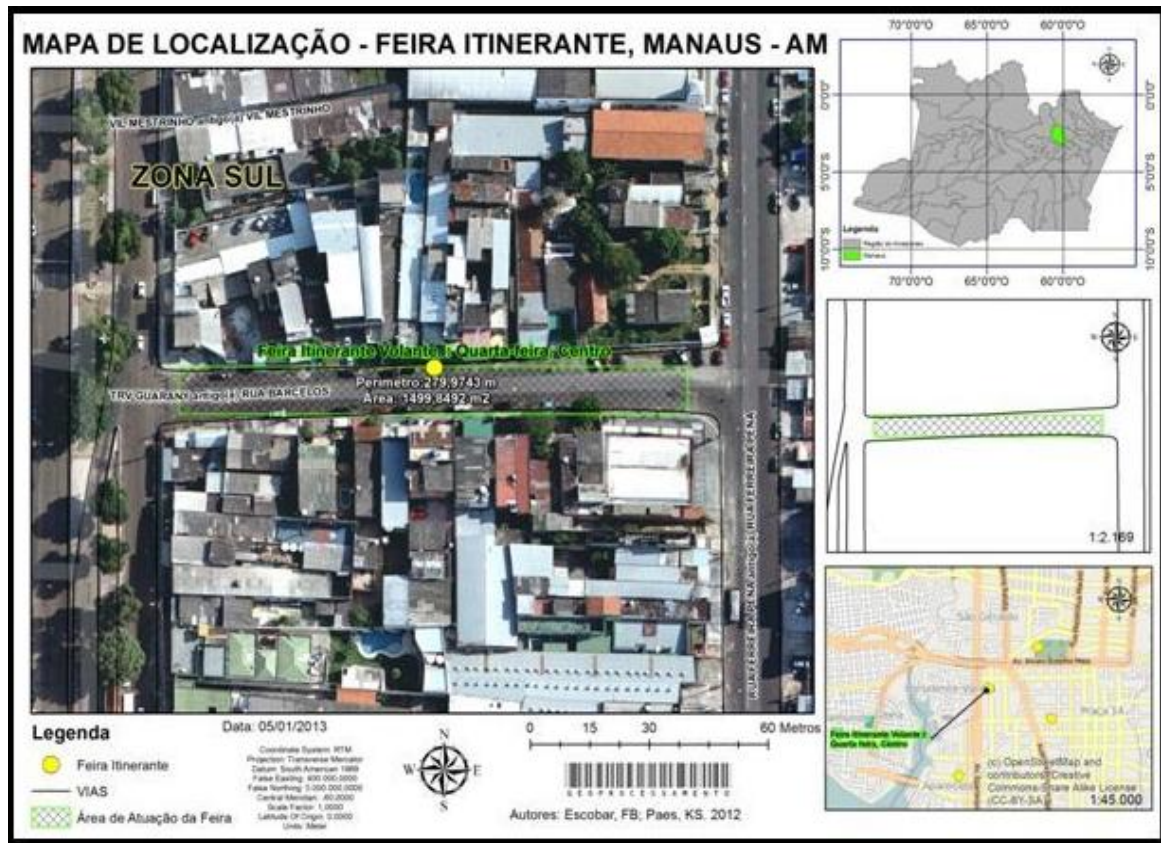
Figura 03 - Mapa de localização feira itinerante Presidente Vargas, Centro Manaus-AM.