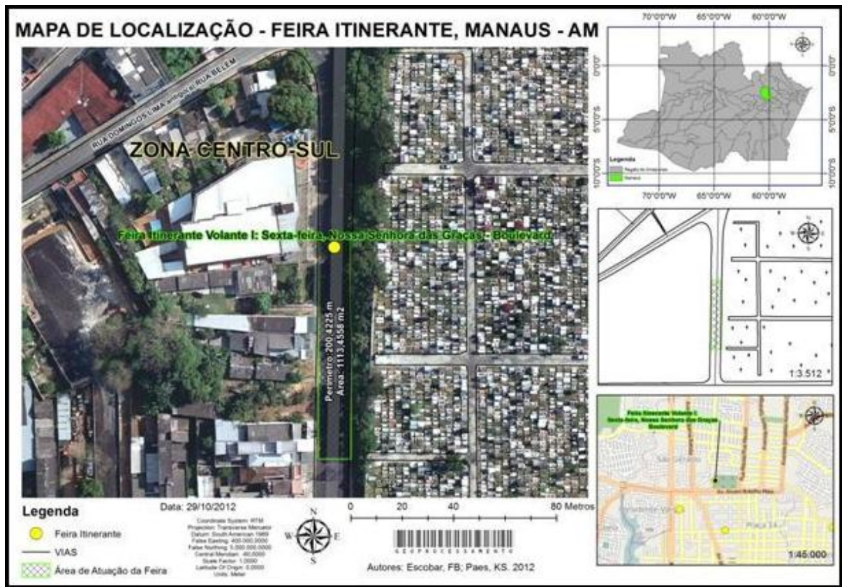
Figura 05 - Mapa de localização feira itinerante Nossa Senhora das Graças - Boulevard, Manaus - AM.