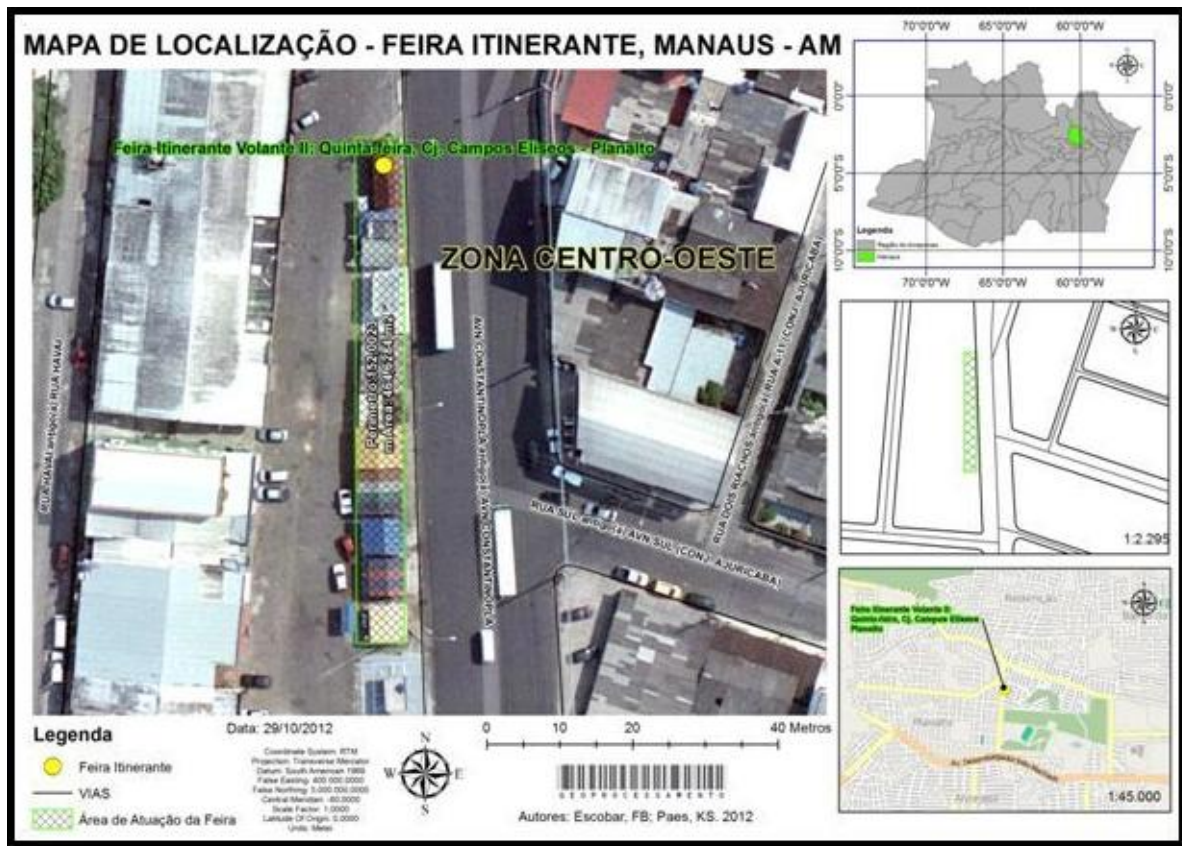
Figura 08 - Mapa de localização feira itinerante Campos Elíseos - Planalto, Manaus - AM.