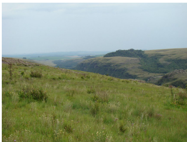
FOTO 9. Campo seco em áreas de solos da Formação Furnas no setor sul de Pirai da Serra.

Em Pirai da Serra, por ser uma região essencialmente rural, a geodiversidade está intimamente ligada à distribuição de atividades como a agricultura e a pecuária. A faixa norte, de solos mais férteis e relevo plano, concentra as áreas agrícolas, enquanto que na faixa sul, próximo à Escarpa Devoniana, em função dos solos mais rasos e pobres e do relevo bastante acidentado, ocorrem pecuária, silvicultura e também a parcela mais preservada de mata e campo nativo da área de estudo (Foto 9) (Prieto, 2007; Almeida, 2009b).