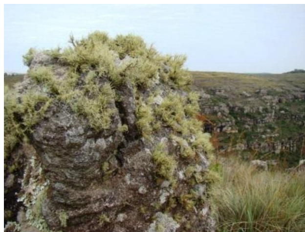
FOTO 10. Hábitat rupícula em bloco rochoso do Arenito Furnas.

Algumas espécies de aves vivem exclusivamente nas florestas (jacuaguçu, tucano, saracura) outras nos campos (quero-quero, curicaca, seriema) e são comuns aquelas que usam os rochedos para construir seus