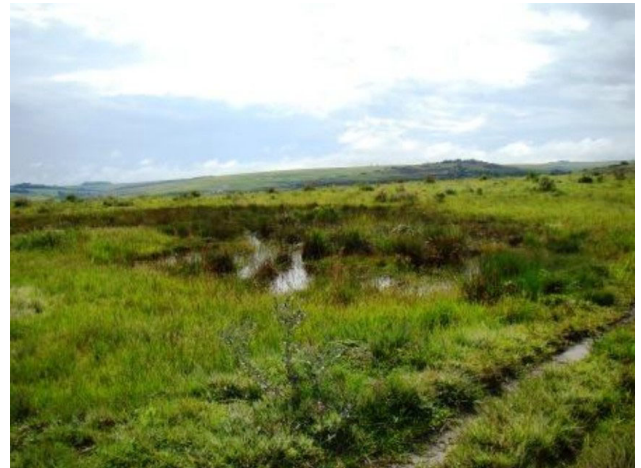
FOTO 8. Campo úmido associado à surgência hídrica e a ORGANOSSOLOS.

do ciclo deste elemento (carbono) no sistema solo – planta – atmosfera. É comum a ocorrência destes solos em topos deprimidos (Foto 8) ou nas encostas com exposição do nível freático, também sendo visíveis no final das vertentes, junto aos cursos d'água.