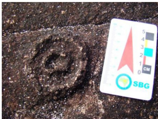
FOTO 11. Círculos concêntricos em alto relevo em lajes do Arenito Furnas.

destes locais poderia aproximar estas hipóteses de algo mais concreto.