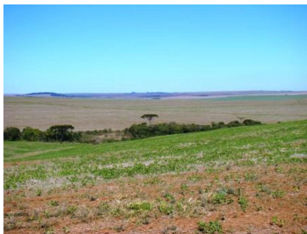
FOTO 7. Áreas de cultivo de soja e milho no setor norte de Pirai da Serra.

Embora sejam visíveis as potencialidades de aproveitamento econômico de alguns recursos geológicos nesta área, sua efetivação está restrita às considerações previstas pelo Zoneamento Ecológico-Econômico da Área de Proteção Ambiental (APA) da Escarpa Devoniana, que engloba a região de Pirai da Serra. A APA da Escarpa Devoniana é uma unidade de conservação de uso sustentável do SNUC, estabelecida em 1992, mas efetivada somente com a aprovação do plano de manejo, em 14 de dezembro de 2005. O zoneamento estabelece três zonas de proteção, três zonas de proteção especial, doze zonas de conservação e outras zonas de uso especial. Pirai da Serra é englobada pela Zona de Proteção 2 (ZP2) e a Zona de Conservação 6 (ZC6). As restrições e recomendações para estas duas zonas podem ser verificadas no plano de manejo da APA (IAP, 2004).