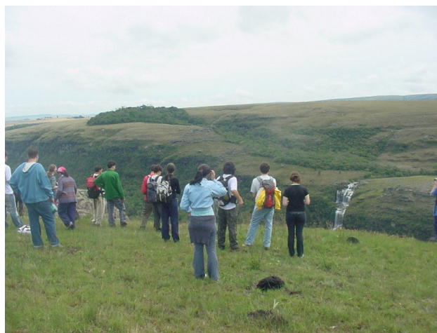
FOTO 12. Alunos de Geografia (UEPG) em atividade prática do minicurso sobre geoparques.

As etapas de campo realizadas por conta deste presente trabalho possibilitaram identificar vários pontos geológicos de interesse didático, como exposições de