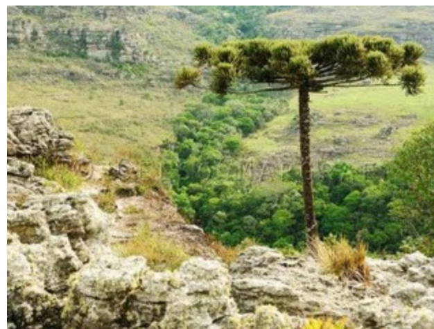
FOTO 6. Foto de Celso Margraf premiada no Concurso de Fotografias da AMCG em 2009, categoria “Paisagens dos Campos Gerais”.

Os cenários naturais dos Campos Gerais já foram palco de algumas produções artísticas (telas, fotografias) e televisivas. O famoso pintor francês Jean Baptiste Debret passou pela região dos Campos Gerais em meados de 1827, durante o período em que esteve no Brasil a serviço da Missão Artística Francesa. Ele retratou em suas telas muitas paisagens e cenas dos costumes da sociedade brasileira, e no caso desta região são conhecidas telas que retratam a vida dos tropeiros. Em 2009 a AMCG lançou um concurso de fotografias com o tema “Paisagens dos Campos Gerais”, com objetivo de valorizar o rico patrimônio natural e cultural da região. Piraí da Serra foi registrada pelas lentes do fotógrafo Celso Margraf, que com uma de suas fotos