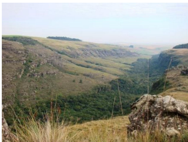
FOTO 4. Mata ombrófila mista no fundo do canyon Palmeirinha.