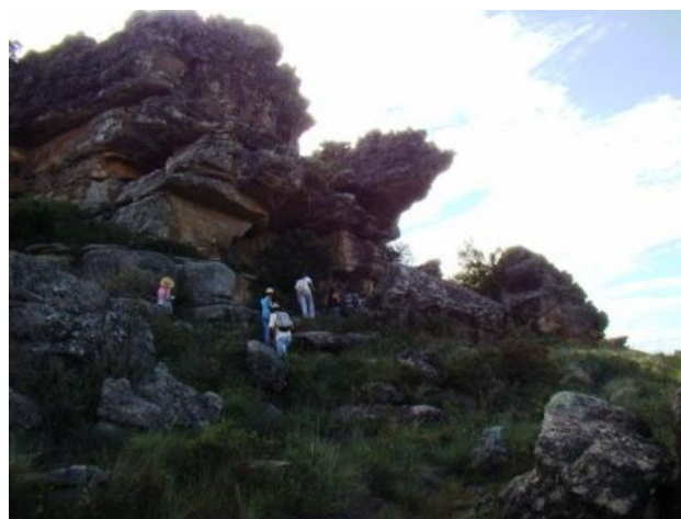
FOTO 5. Relevos ruiniiformes: passeio oferecido pela Pousada Serra do Pirahy.

individualmente ou em conjunto, revelam um magnífico cenário.