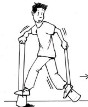
Figura 3. Plataforma com apoio nas mãos (cordas)

Durante os últimos anos observamos a utilização do modelo 1, como experiência prévia ao modelo 2, no entanto, nossas experiências indicam que, como recurso pedagógico antes da utilização do modelo ideal de perna de pau (2), o mais adequado é utilizar as “plataformas” construídas de lata ou de madeira, representadas nas figuras 3 e 4. Estes aparelhos simulam com maior precisão as alterações mecânicas e sensitivas produzidas pela perna de pau normal (modelo 2).