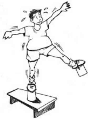
Figura 04. Plataformas amarradas nos pés.

Nossa opção se justifica devido a transferência “positiva” entre os movimentos realizados nas plataformas (3 e 4) e os realizados no modelo normal (2), algo que não acontece com o modelo 01. Além disso, o tipo de equilíbrio praticado nestas plataformas é o mesmo do modelo 2, o que não acontece com o modelo 1, devido ao tipo de apoio (realizado nas mãos). Isso não significa que devemos negar a existência do modelo 1 e deixar de utilizá-lo, simplesmente queremos explicar que não deve ser utilizado como o recurso pedagógico (progressão) mais importante.