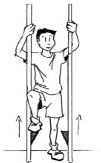
Figura 1. perna de pau com apoio nas mãos. 1

Do ponto de vista do tipo de apoio, existem basicamente dois tipos de pernas de pau: aquelas em que o apoio está nas mãos (ver fig. 1), que de forma livre permitem deixar o material quando o praticante deseje; aquelas em que o apoio está nas pernas (ver fig. 2), que de forma fixa impedem que o praticante abandone o material durante a atividade.