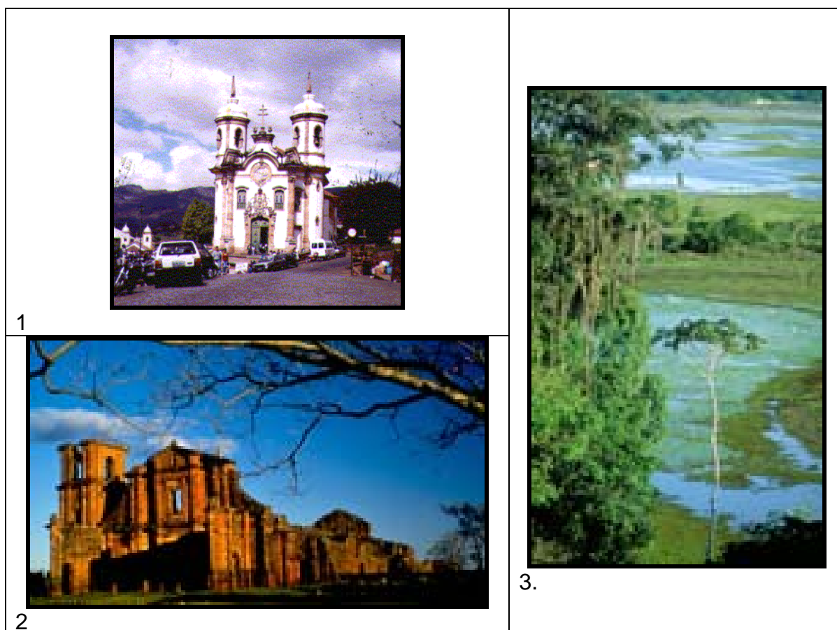
Foto: 1. Igreja São Francisco (Ouro Preto).

No Brasil, foram reconhecidos como Patrimônio Mundial, pela UNESCO, o Parque Nacional de Jaú, Ouro Preto, Olinda, São Miguel das Missões, Salvador, Congonhas do Campo, Parque Nacional do Iguaçu, Brasília, Parque Nacional Serra da Capivara, Centro Histórico de São Luís, Diamantina, Pantanal Matogrossense, Costa do descobrimento, Reserva Mata Atlântica, Reservas do Cerrado, Centro Histórico de Goiás e Ilhas Atlânticas (Fotos 1, 2 e 3).