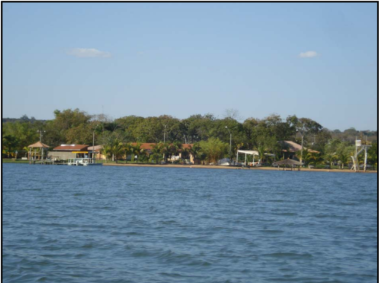
Figura 05 - Pousada Tucunaré, margem esquerda do rio Sucuriú no baixo curso. Retirada de extensa faixa da mata ciliar ao longo do reservatório na Usina Hidrelétrica de Jupia da CESP.

Bom Jardim; Solar das Gaivotas; Riviera; Varginha; Projeto Paraíso, entre outros. Quanto à origem dos proprietários, 80,4% são do município de Três Lagoas; 3,5% de Campo Grande; 2,3% de Andradina, e os demais de outros estados brasileiros, destacando-se o estado vizinho, São Paulo, com 9,0%.