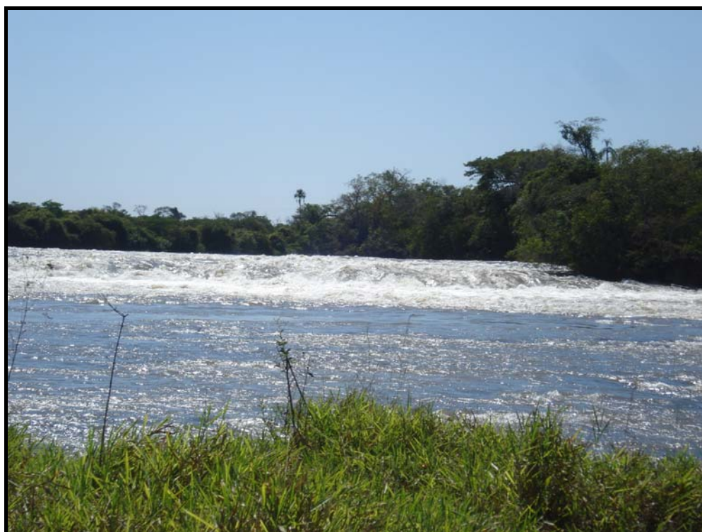
Figura 02 - Forte turbilhonamento da água do rio Sucuriú devido à queda do Salto da Laranja, fundo rochoso da Formação Serra Geral, Primeira Estação de Monitoramento.

A Tabela 03 mostra que as concentrações de OD estão em conformidade com a Resolução CONAMA n.357/2005, com valores de OD superiores a 10 mg/l, nas estações 1 até 11, enquadrando-se na Classe Especial, quanto à qualidade aferida. A estação 1 localizada no Salto da Laranja, devido a forte correnteza e a queda de 4 metros, registrou elevada concentração, superior a 11 mg/l, (Figura 02). Contudo, o uso agropecuário e os desmatamentos, desrespeitando a legislação ambiental referente à preservação das matas ciliares e a ausência de práticas conservacionistas de plantio das pastagens e manejo dos animais, comprometem a destinação recomendada pela resolução CONAMA 357/2005, que preconiza em seu artigo 4º “a preservação do equilíbrio natural das comunidades aquáticas e à preservação dos ambientes aquáticos em unidades de conservação de proteção integral” (Tabelas 03 e 04) (BRASIL, 2005).