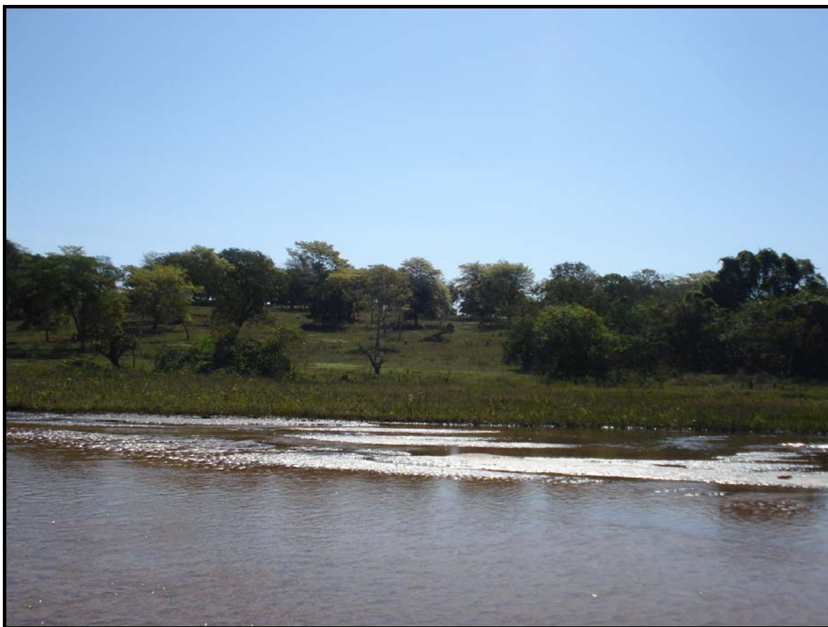
Figura 03- Retirada da Mata Ciliar e plantio de pastagens até as margens do Rio Sucuriú, médio curso da bacia no município de Três Lagoas, próximo a foz do Ribeirão Brioso. Fonte: Lariane de Paula e Silva, ago/2008.

Conseqüentemente, as estações de 1 a 11 enquadram-se na Classe Especial, e a 12 e 13, na classe I, apontando, apesar da boa qualidade de suas águas, o alerta de que o uso da terra no baixo curso da bacia, em especial, após o Ribeirão Campo Triste, está comprometendo a qualidade de suas águas, pois as concentrações de OD caíram para menos de 10 mg/l e mais de 6 mg/l. Destacam-se nessas áreas a rala e esparsa mata ciliar; o uso agropecuário sem práticas conservacionistas adequadas (Figuras 03); e a grande concentração de ranchos de veraneio e pesca – segunda residência –, que ocupam áreas de preservação ambiental e não possuem infra-estrutura sanitária adequada (Figura 04).