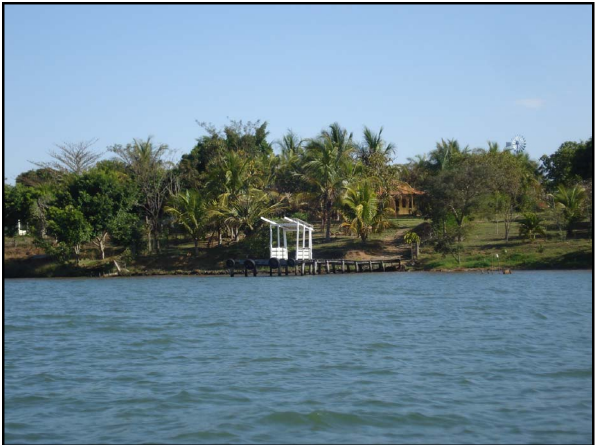
Figura 04 - Ranchos de Veraneio e Pesca na margem esquerda do Sucuriu, com esgotamento sanitário ligados a fossas rudimentares a distâncias inferiores a 30 metros da margem.

Ressalta-se que tanto os resíduos sólidos quanto líquidos podem causar alterações químicas, físicas e biológicas nos cursos d'água e essas alterações podem corresponder à elevação ou queda do PH; à quantidade de oxigênio dissolvido; sendo que a diminuição ou aumento da temperatura da água podem também afetar a biodiversidade aquática a saúde das pessoas que utilizam dessas águas.