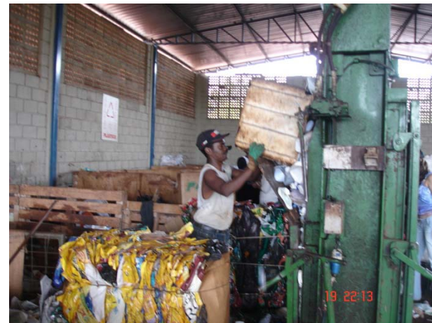
Central de Triagem de Recicláveis de Ribeirão Preto, SP - 2006