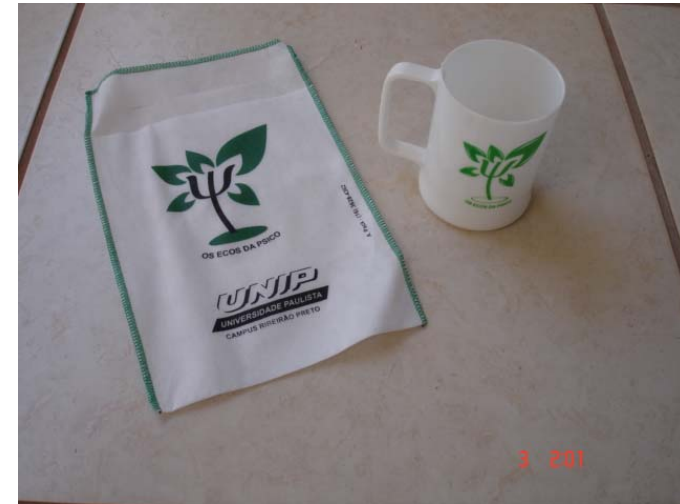
Saquinhos de Lixo para Carro e canecas duráveis