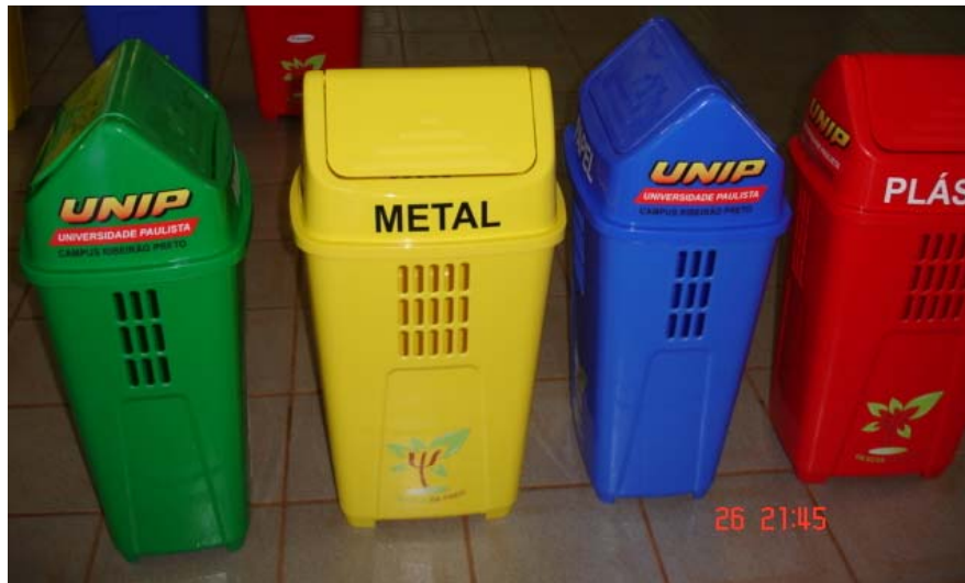
Containers para Materiais Recicláveis