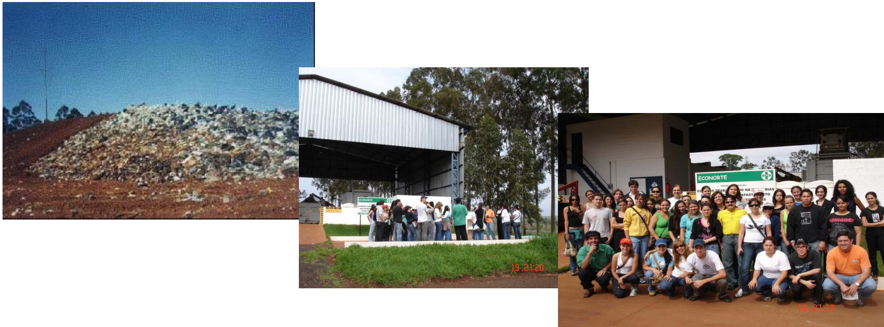
Aterro sanitário de Ribeirão Preto, SP - 2006