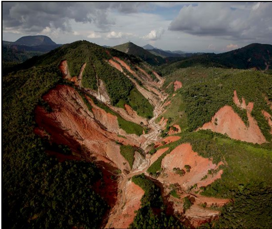
Fig.01: Deslizamentos em morros do Rio do Estado do Rio de Janeiro em janeiro de 2011.