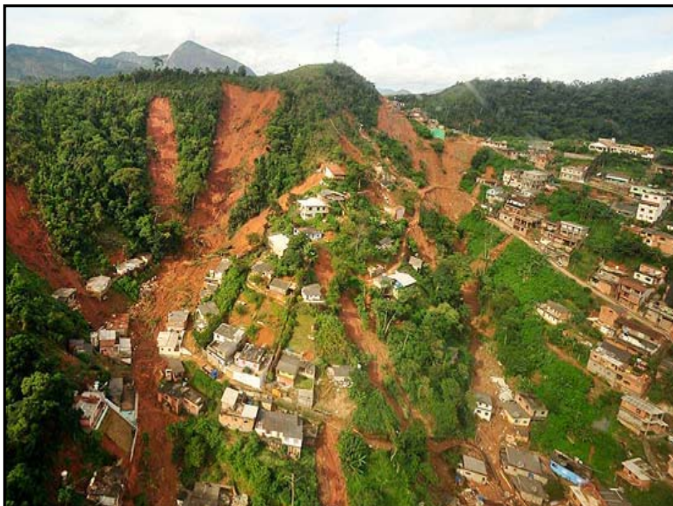
Fig. 02: Deslizamento em morro de Nova Friburgo na região serrana do Rio de Janeiro.