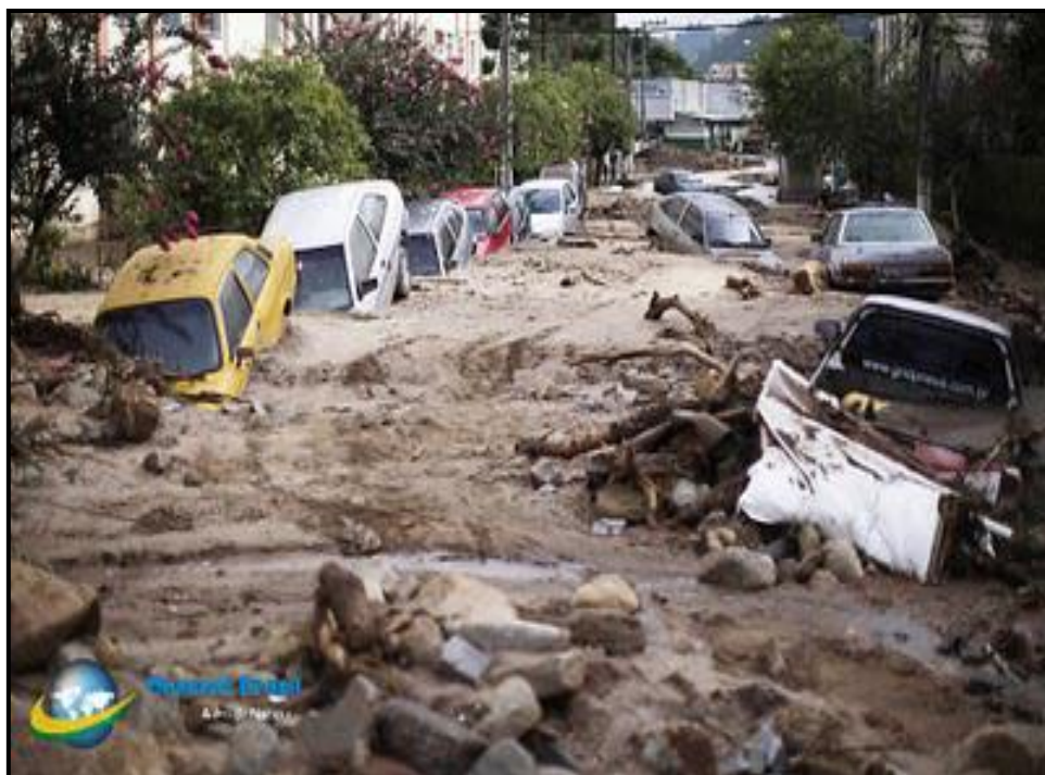
Fig. 03: Tragédia no Estado do Rio de Janeiro.

Está em fase de aprovação no Congresso Nacional, desde 2010, o novo Código Florestal Brasileiro. Mencionamos aqui, uma observação do professor de engenharia florestal do Rio de Janeiro, Eleazar Volpato, que manifestou a sua preocupação, pois as flexibilizações propostas no Relatório do deputado Aldo Rebelo agravam de forma absoluta a situação das ocupações de morros e encostas, em toda a região da Mata Atlântica,