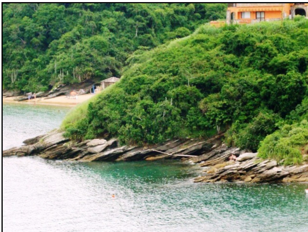
Fig. 11: Praia João Fernandes, Área Interpretativa.