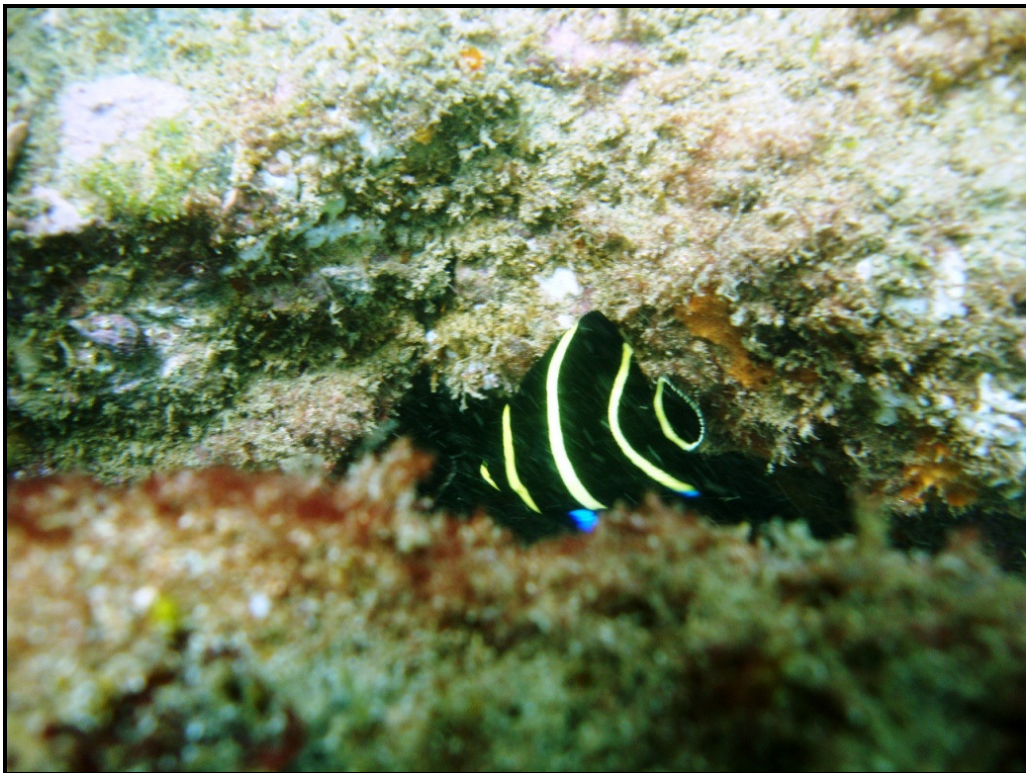
Fig. 5: Peixe na área interpretativa '1'.