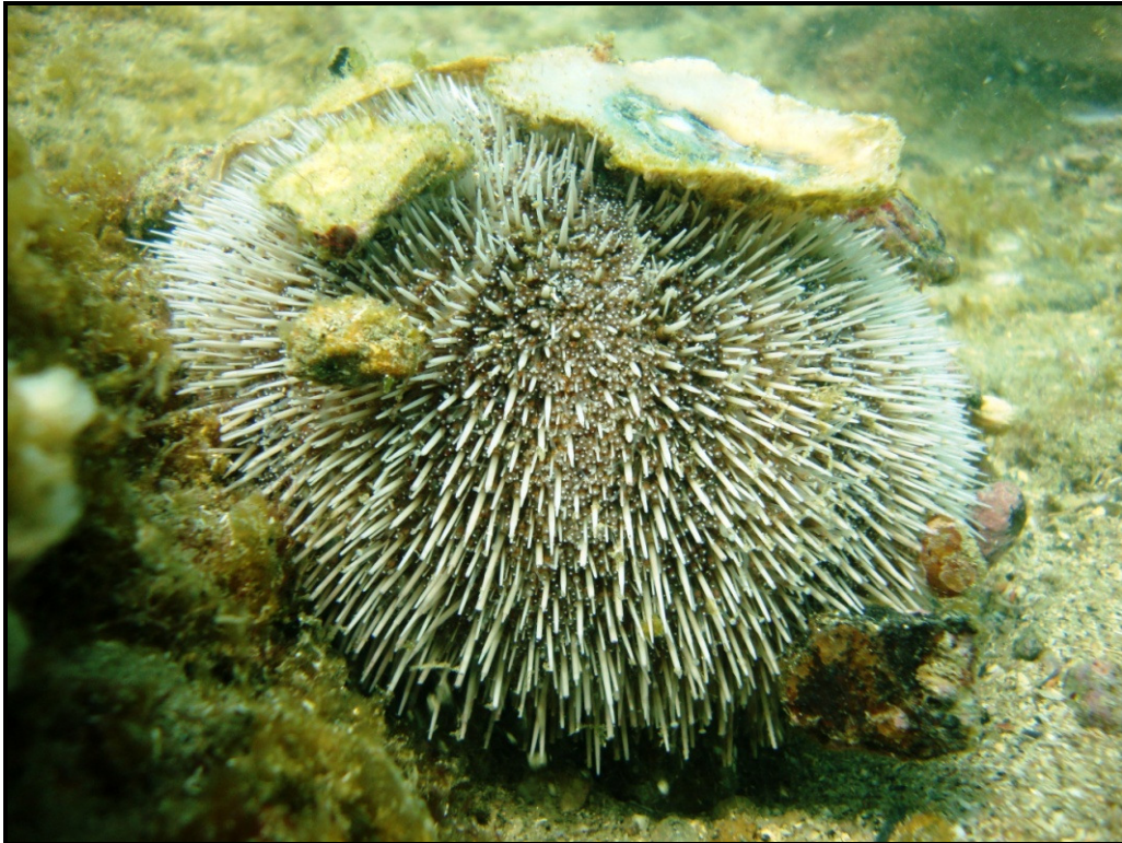
Fig. 4: Ouriço Branco.