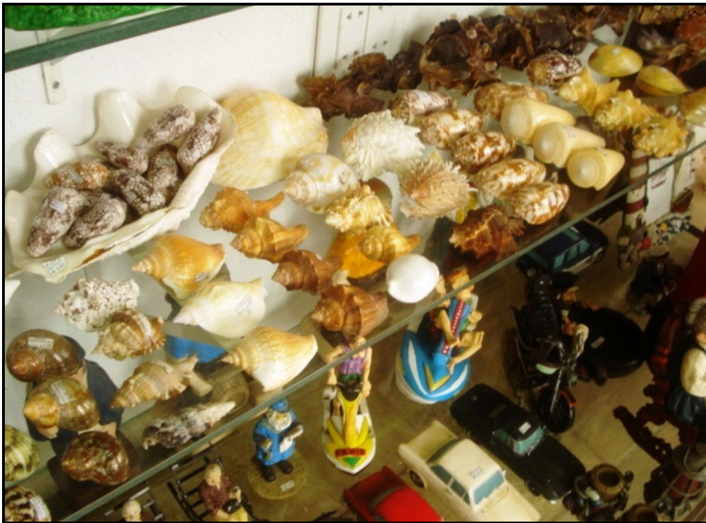
Fig.9: Loja com venda de moluscos em Búzios.