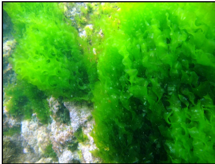
Fig. 1: Alga Ulva.