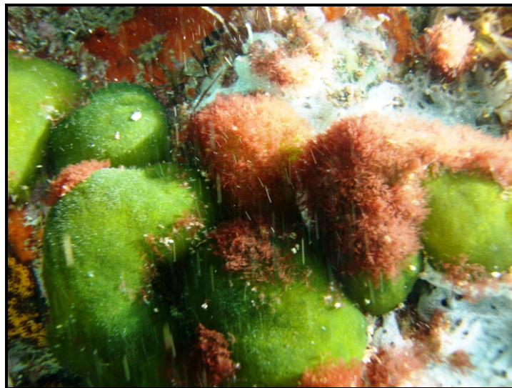
Fig. 2: Codium sponjosum epifitado.