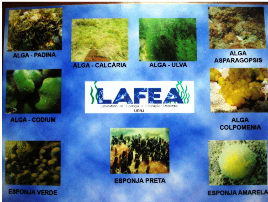
Fig. 7: Ficha Interpretativa, Projeto EcoTurisMar.