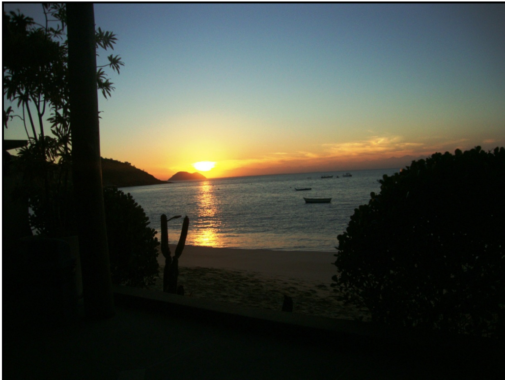
Fig. 10: Por do Sol em Buzios.