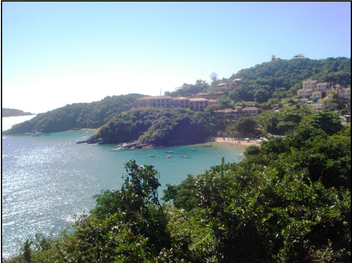
Fig. 12: Vista da Área de Estudo em Buzios.