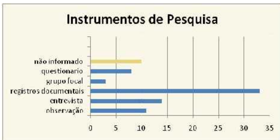
Figura 2. Distribuição dos trabalhos em relação aos instrumentos de pesquisa.

A forte presença de trabalhos que continham análises documentais fica mais clara quando os participantes apontaram que, em relação aos instrumentos de coleta utilizados, havia grande número de referências a registros documentais: